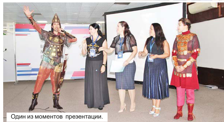
Один из моментов презентации.

А что же ждет газеты? В перспективе – только «бесплатка». То есть, читатель будет получать газету бесплатно. Все расходы на её производство – за счёт рекламодателя. Это не только бизнес-структуры, но и всевозможные ведомства. Главред «КП» подчеркнул, что как раз госструктуры – главный рекламодатель. По крайней мере,